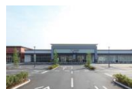
フォレストモール甲斐竜王