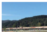
フォレストモール仙台茂庭