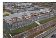
フォレストモール木津川