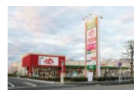
フォレストモール八王子大和田

●全ての催事場は屋外にございます。●会場のご予約はお申込み日の翌月末まで承っております。また抽選申込期間と一般申込期間を設けております。(抽選申込期間) 毎月第1月曜日から当週の金曜日までに、上述の「お問い合わせフォーム」またはお電話・メール等でお申込みください。翌週の火曜日を目途に担当者より結果をお知らせ致します。(一般申込期間) 抽選申込期間以降、会場に空きがある場合にご予約を承らせて頂きます。●備品(机・椅子他)は施主様にてお持ち込みください。●備品の事前発送等の受付(現地でお受取り・保管)は致しかねます。施設内店舗でも対応致しかねますので当日にご持参ください。●発生したごみは全て施主様にてお持ち帰りください。●施設内に出店している店舗で取り扱いのある商品や類似する商品を取り扱う場合は、ご出店をお断りさせて頂く場合がございます。またそれ以外の場合でも当施設に相応しくないと弊社にて判断した場合は、ご出店をお断りさせて頂く場合がございます。●「催事出店申込書」及び「催事場使用確認書」記載事項に違反した場合、会場使用許可を取り消させていただきます。尚、使用許可取消に伴う損害等については、弊社は一切の責任を負いません。