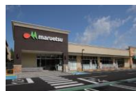
フォレストモール印西牧の原