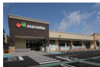
フォレストモール印西牧の原