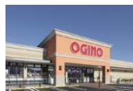
フォレストモール富士川