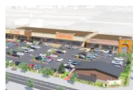
フォレストモール佐久平