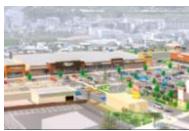
フォレストモール岩出