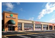
フォレストモール岡谷