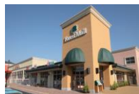
フォレストモール富士河口湖