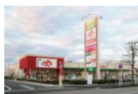
フォレストモール八王子大和田