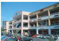
フォレストモール南大沢

全国のフォレストモールで催事スペースをご用意しております。(クリックすると各施設ホームページに移動します)