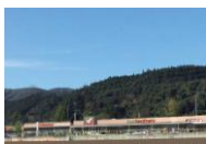
フォレストモール仙台茂庭