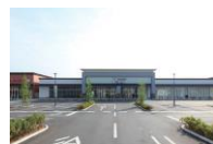
フォレストモール甲斐竜王