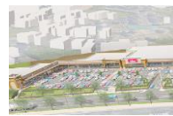
フォレストモール京田辺

● 全ての催事場は屋外にございます。● 会場のご予約はお申込み日の翌月末まで承っております。また抽選申込期間と一般申込期間を設けております。(抽選申込期間) 毎月第1月曜日から当週の金曜日までに、上述の「お問い合わせフォーム」またはお電話・メール等でお申込みください。翌週の火曜日を別途に担当者より結果をお知らせ致します。(一般申込期間) 抽選申込期間以降、会場に空きがある場合にご予約を承らせて頂きます。● 備品(机・椅子他)は施主様にてお持ち込みください。● 備品の事前発送等の受付(現地でお受取り・保管)は致しかねます。施設内店舗でも対応致しかねますので当日にご持参ください。● 発生したごみは全て施主様にてお持ち帰りください。● 施設内に店舗している店舗で取り扱いのある商品や類似する商品を取り扱う場合は、ご出店をお断りさせて頂く場合がございます。またそれ以外の場合でも当施設に相応しくないと感じた場合は、ご出店をお断りさせて頂く場合がございます。● 「催事出店申込書」及び「催事場使用確認書」記載事項に違反した場合、会場使用許可を取り消させていただきます。尚、使用許可取消に伴う損害等については、弊社は一切の責任を負いません。