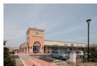
フォレストモール新前橋