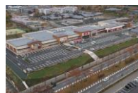
フォレストモール木津川